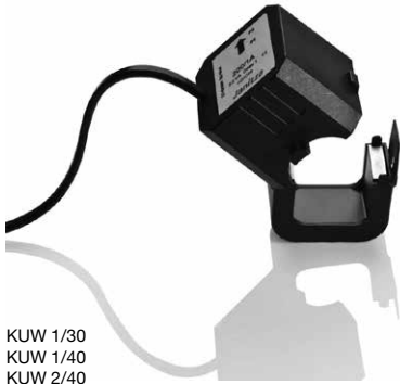
KUW 1/30 KUW 1/40 KUW 2/40 KUW 4/60 KUW 4.2/60

Read this installation guide before installing the product